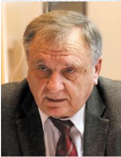
Уладзімір Рыгоравіч ШЧАСНЫ, Надзвычайны і Паўнамоцны Пасол у адстаўцы