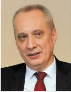
Андрэй Вадзімавіч ДАПКЮНАС, намеснік міністра замежных спраў Рэспублікі Беларусь