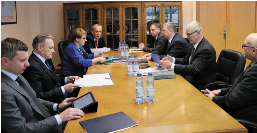
КРУГЛЫ СТОЛ. ДЗЯРЖАВАЙ УПАЎНАВАЖАННЯ

дынуюць сваю дзейнасць. І калі гаварыць пра сітуацыю да 1991 года, то, канечне ж, была каардынацыя дзеянняў беларускай дыпслужбы з дэлегацыямі СССР, УССР, сацыялістычных краін у межах дзейнасці ААН. Можна правесці паралель з цяперашняй каардынацыяй дзеянняў дзяржаў унутры Еўрапейскага саюза, калі краіна-каардынатар робіць узгодненую з іншымі членамі заяву ад імя ЕС па той ці іншай міжнароднай праблеме.