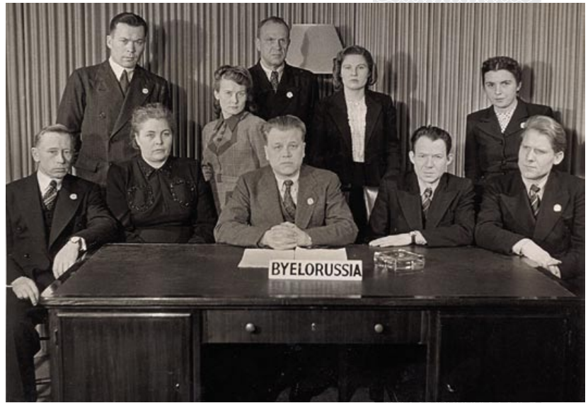
▲ Дэлегацыя БССР на чале з міністрам замежных спраў К.В. Кісялёвым (у цэнтры) на першай сесіі Генеральнай Асамблеі Арганізацыі Аб'яднаных Нацый. Лондан, 1946 год