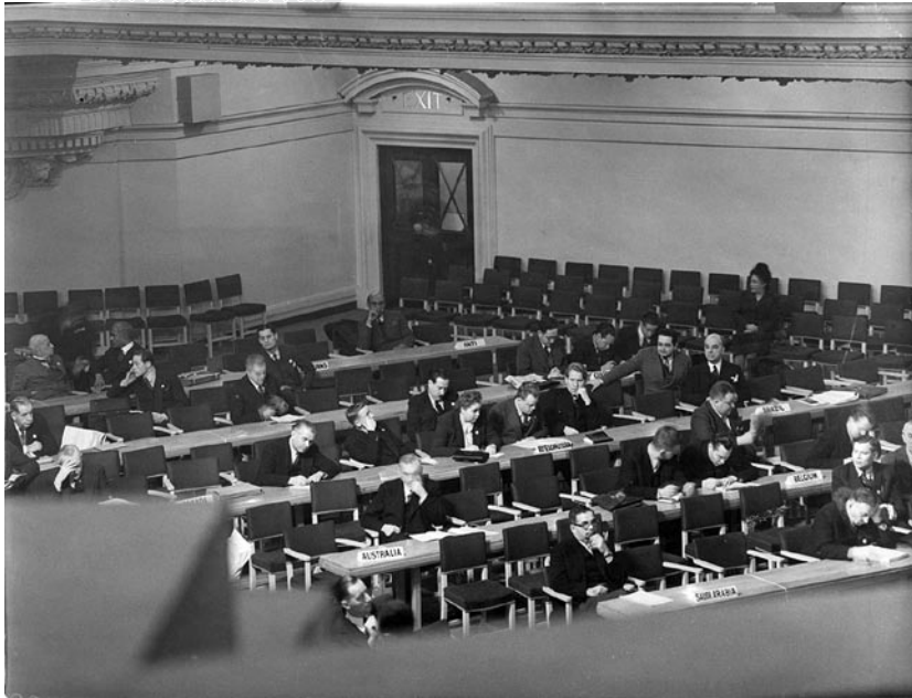
▲ У час першай сесіі Генеральнай Асамблеі ААН. Лондан, 1946 год